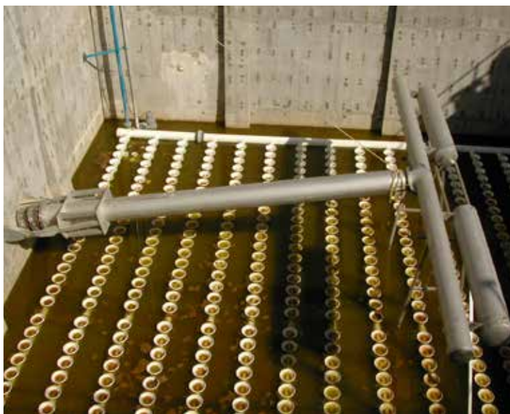
Läckeby Products dekanter installerad i Buenaventura, Chiapas i Mexiko.

Som standard tillverkas dekantern i rostfritt material eller syrafast material. Utloppsroret är försett med en flexibel koppling i nedre änden. Konstruktionen innefattar även stöd för dekantern vid tömning av SBR-bassängen. Läckeby Products dekanter kräver minimalt underhåll, eftersom den varken innehåller pumpar, ventiler eller elektriska drifter.